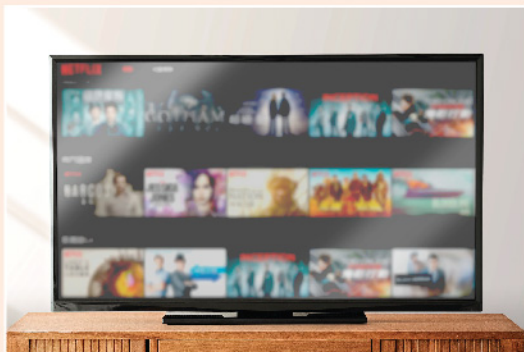
▲ 收費視頻平台其中一個成功因素，就是「內容為王」。

又是時候跟大家回顧德國股神科斯托蘭尼其中一句名言：「買入股票需要想像力，賣股票則要理性現實」。這句說話大部分投資者應該也不會感到陌生，甚至乎會認為是老生常談。不過當中真諦卻未必人人可以掌握，筆者自問亦處於領略階段。至於為何突然重提此名言，其實是想借此帶出港股現時之境況。執筆之時港股年初至今累跌 11%，最低曾