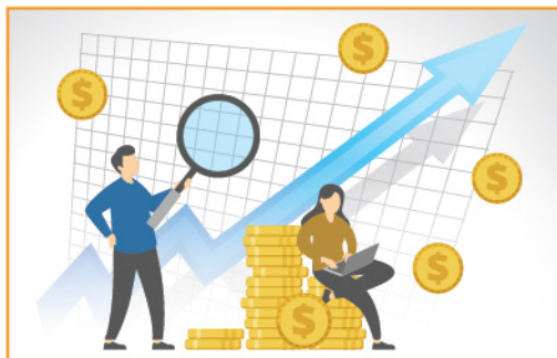
▲ 近期股市急跌之後急劇反彈，正是利用「沽出備兌認購期權」(Covered Call) 處理倉底蟹貨的好時機。

股票期權有一種策略很適合投資者處理倉底蟹貨，那便是「沽出備兌認購期權」策略 (Covered Call)。投資者在持有正股的情況下，不需要付出按金，便可以開倉 Short Call 收取期權金。